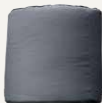
STOLIK | 01