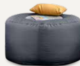
STOLIK | 03