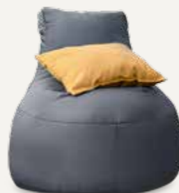
FOTEL | 03