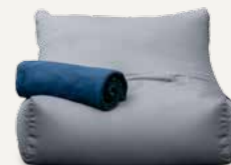
FOTEL | 04