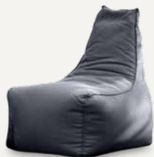
FOTEL | 01