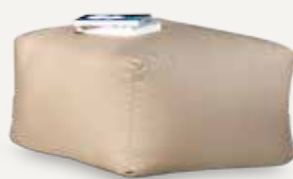
STOLIK | 02