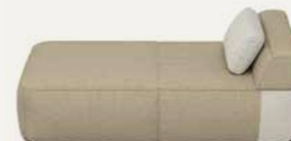
PUFFY | 02