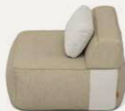
PUFFY | 01