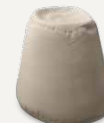
HOCKER | 04