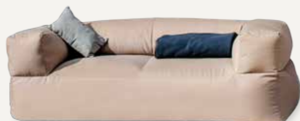
SOFA | 02