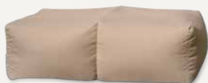
ŁAWECZKA | 05