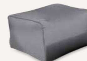
PODNÓZEK | 01