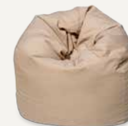
PUF-WOREK | 05