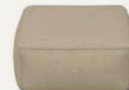
PUFFY | 03