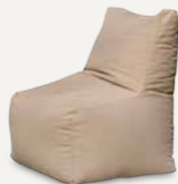
FOTEL | 02